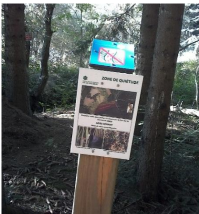
Figure 2: Photographie de la signalétique actuelle régulièrement mise à terre