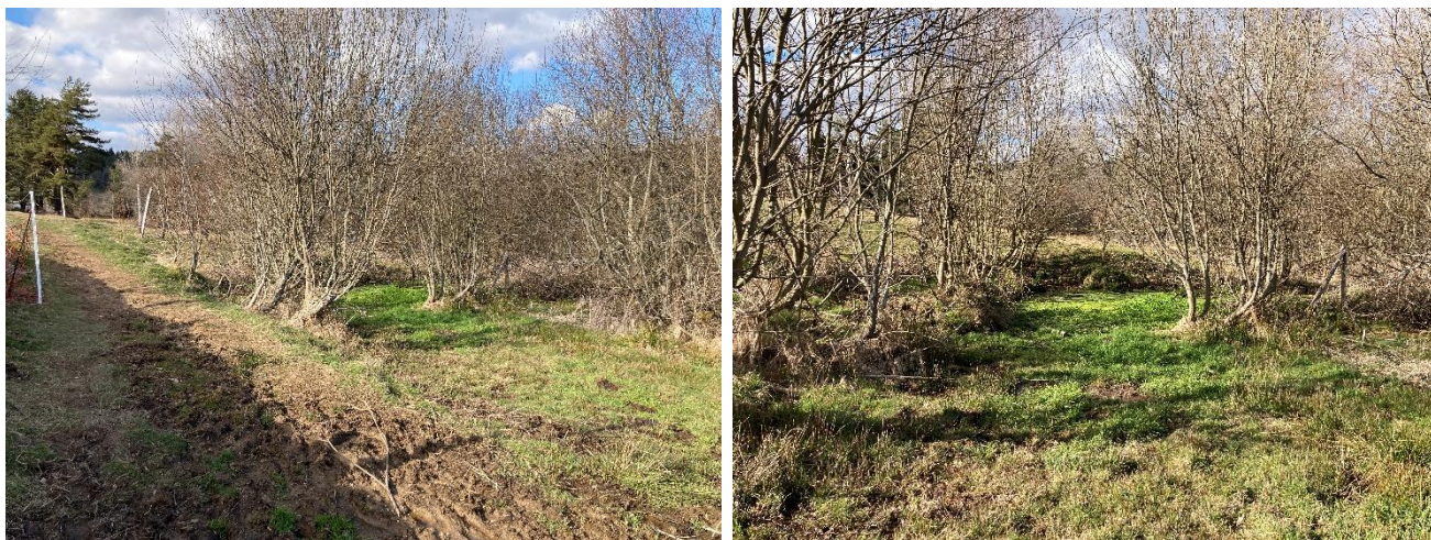
Figure 3 : Photographie du secteur N°2

Le prestataire fournira les croquis/plans précis et techniques des aménagements proposés. Une liste précise du matériel nécessaire et des fournitures sera également transmise. L'objectif est que le gestionnaire la réalisation des aménagements préconisés puisse être enclenchée grâce aux livrables fournis.