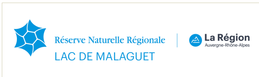
Logo de la Réserve