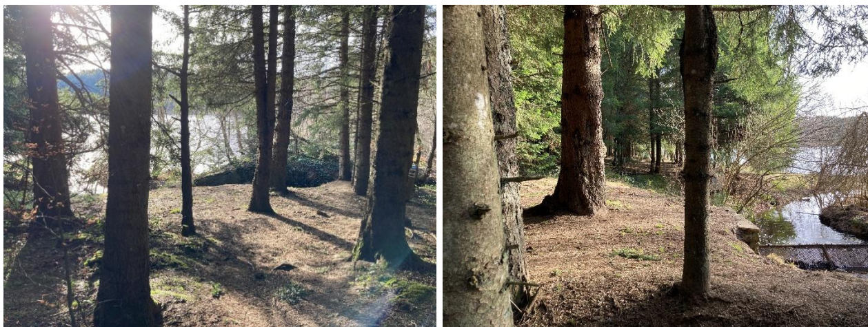
Figure 1: Photographies du secteur n°1

L'objectif est que la gestionnaire la réalisation des aménagements préconisés puisse être enclenchée grâce aux livrables fournis.